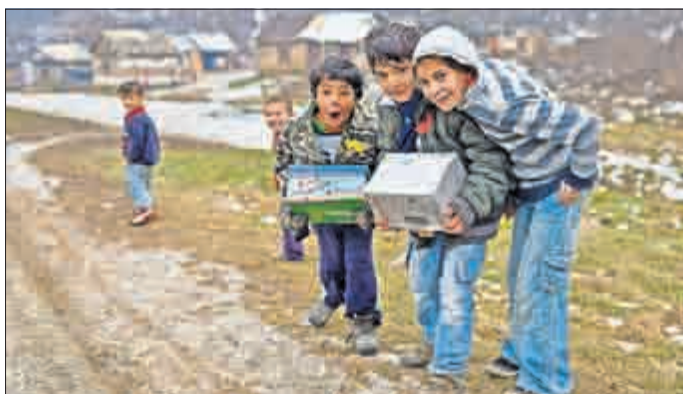
Roma-Kinder freuen sich über ihre Geschenke

Seit 1993 wurden bereits über 110 Millionen Kinder in rund 150 Ländern beschenkt. Allein 2013 wurden weltweit etwa 9,9 Millionen Päckchen gesammelt, davon 493.288 im deutschsprachigen Raum. Ellen Stöckner hofft, dass sich viele Bürger, Unternehmen, Schulen, KiTas und Gemeinden motivieren lassen, sich an der Aktion zu beteiligen: „Unser Ziel ist es, dass sich in diesem Jahr wieder mindestens 500.000 Kinder über Päckchen aus dem deutschsprachigen Raum freuen können.“ Seit dem Aktionsstart in Deutschland 1996 wurden bereits über sechs Millionen Kinder beschenkt.