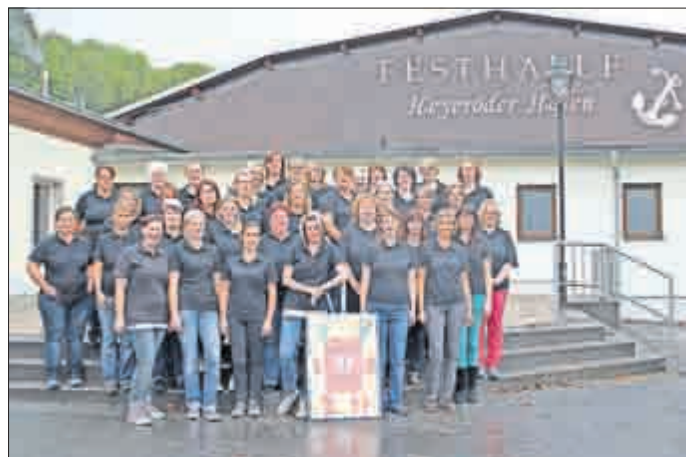
Euer Basar-Team Heyerode

Wir, das Basar-Team Heyerode, möchten einen kleinen Beitrag für die Kinder unseres Dorfes leisten. Wir wissen auch, dass diese Hilfe an manchen Stellen dringend notwendig ist. Deshalb machen wir es uns zur Aufgabe, zu helfen.